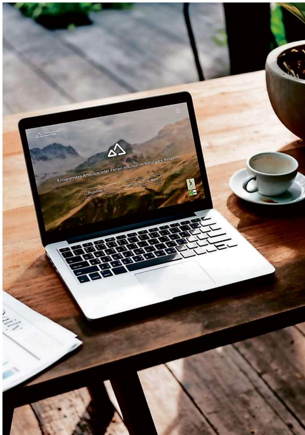
Der Naturpark Beverin will zur Stärkung der Standortattraktivität ein Fernarbeit-Angebot lancieren.

Regionale Veranstaltungen: 3. November, 9 bis 10.30 Uhr, Gasthaus «Rathaus», Safien-Platz. – 4. November, 12 bis 13.30 Uhr, Hotel «Fravi», Andeer. – 5. November, 15.30 bis 17 Uhr, Hotel «Suretta», Splügen. Anmeldung bis am 30. Oktober an Adrian Steiner, adrian.steiner@naturpark-beverin.ch , 081 630 60 15.